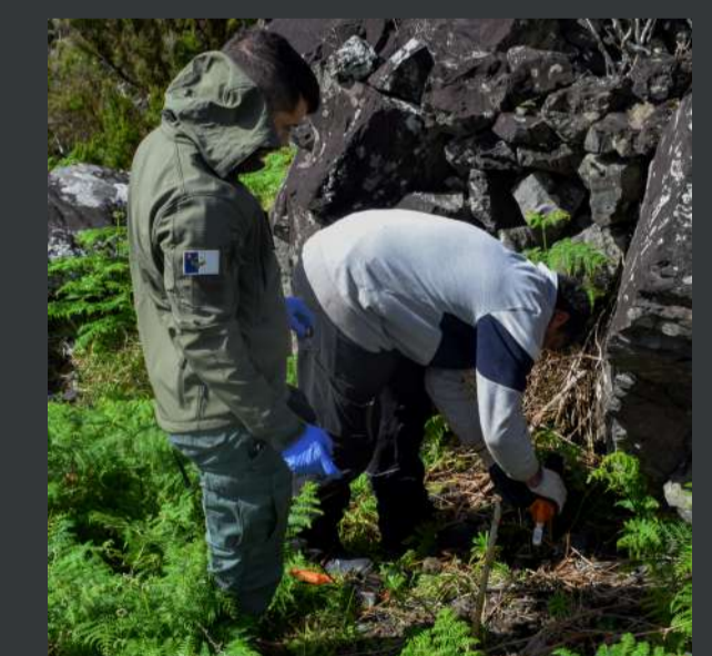
Instalação de armadilhas para roedores / Installation of traps for rodents