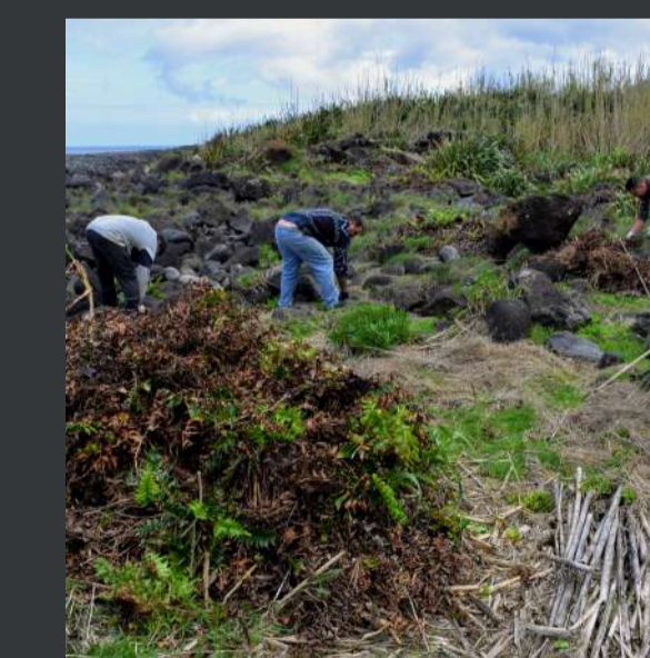
Controlo de flora exótica invasora / Invasive alien flora control