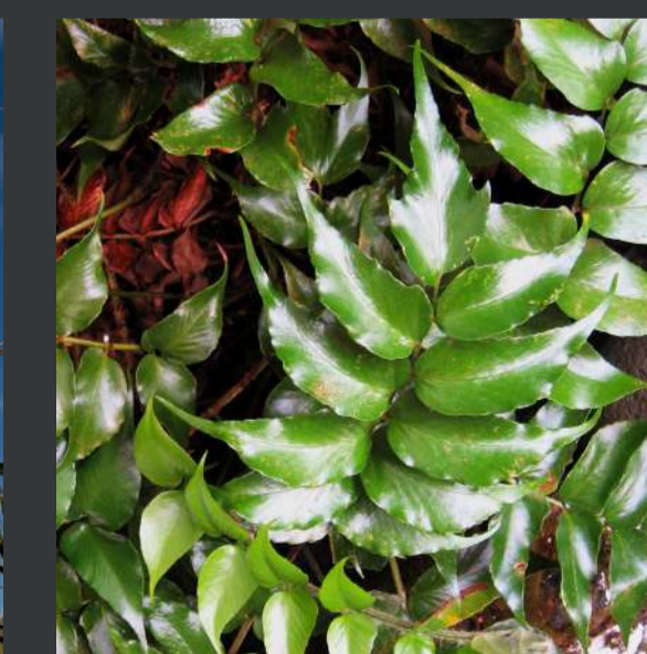
Feto-azevinho / Cyrtomium falcatum