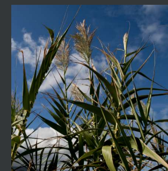
Cana / Arundo donax