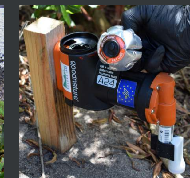
Instalação de armadilhas para roedores / Installation of traps for rodents