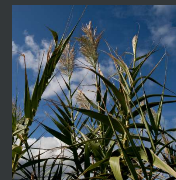
Cana / Arundo donax