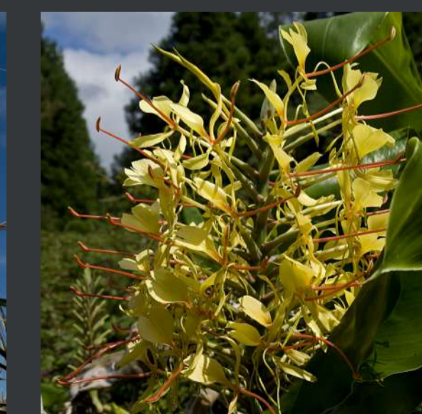
Roca-da-velha / Hedychium gardnerianum