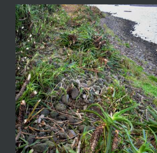
Controlo de espécies de flora invasora / Invasive alien flora control