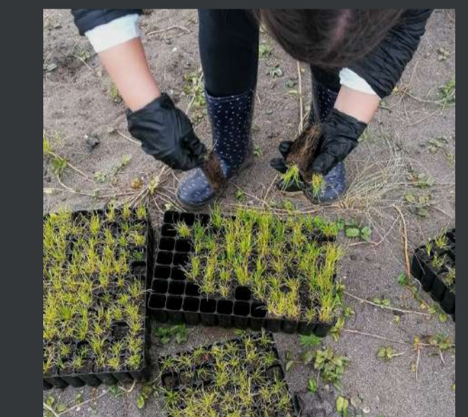
Atividades com escolas / Activities with schools