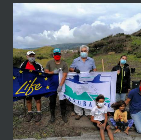
Atividades com a comunidade / Activities with the community