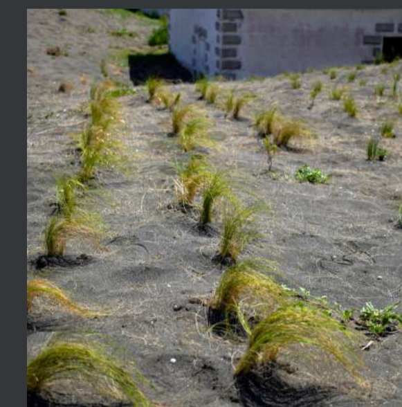
Propagação de flora nativa / Native flora propagation